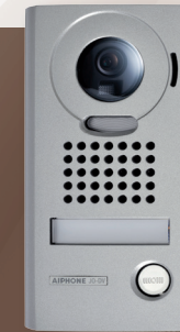
JODV (302949) Platine saillie