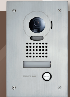
JODVF (302950) Platine encastrée